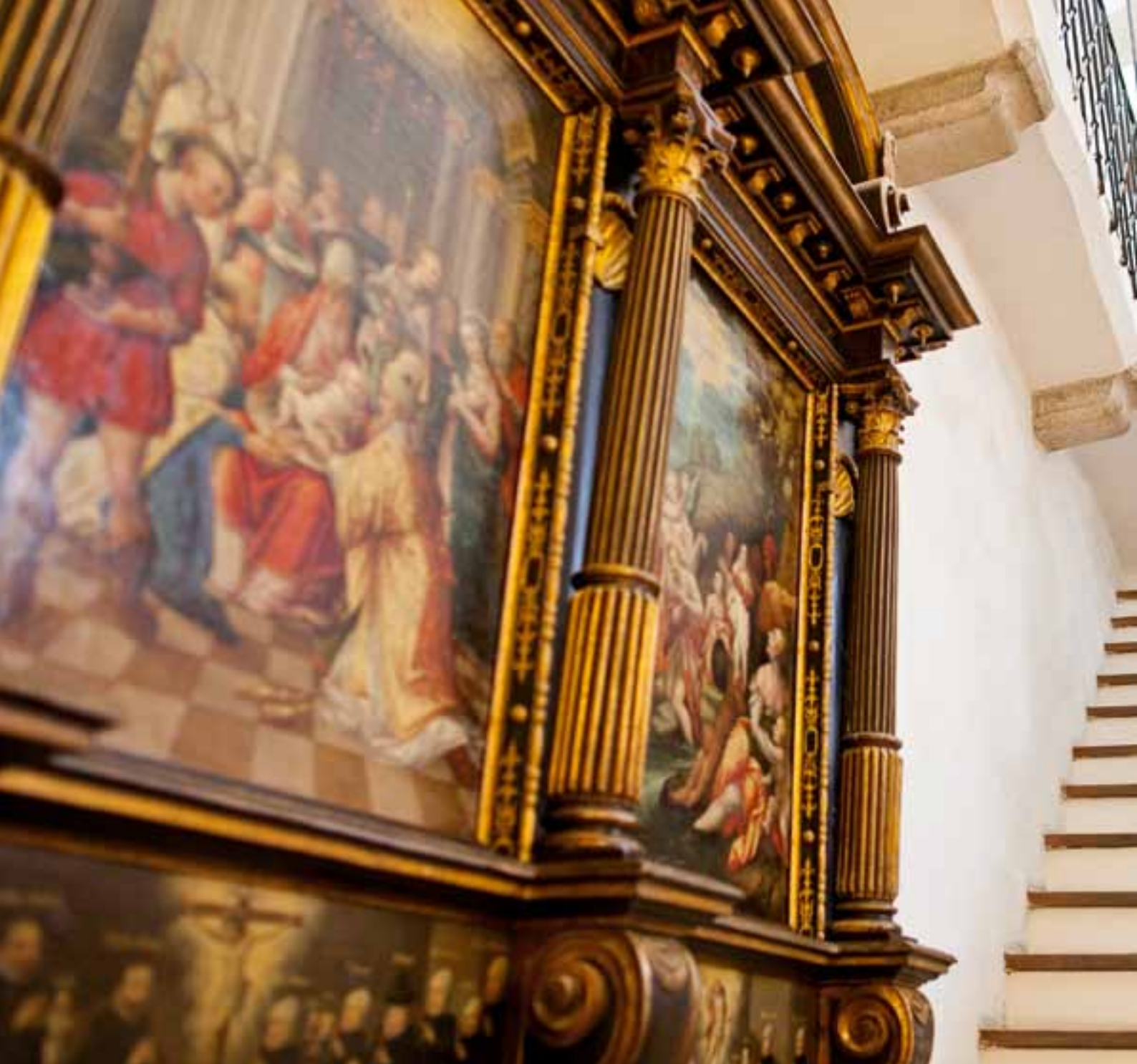
Das Sterzinger Rathaus