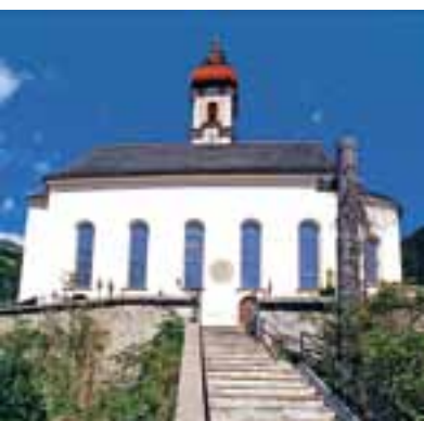
Pfarrkirche in Gossensass

Es verwahrt den größten Teil des bedeutenden spätgotischen Flügelaltars des Ulmer Bildhauers und Malers Hans Multscher von 1459.